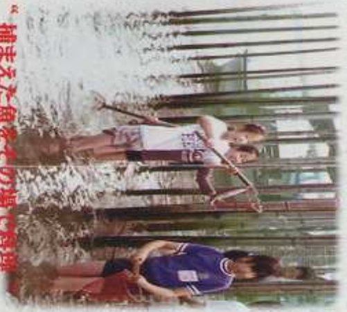
“ 捕まえた魚をその場で料理 ”